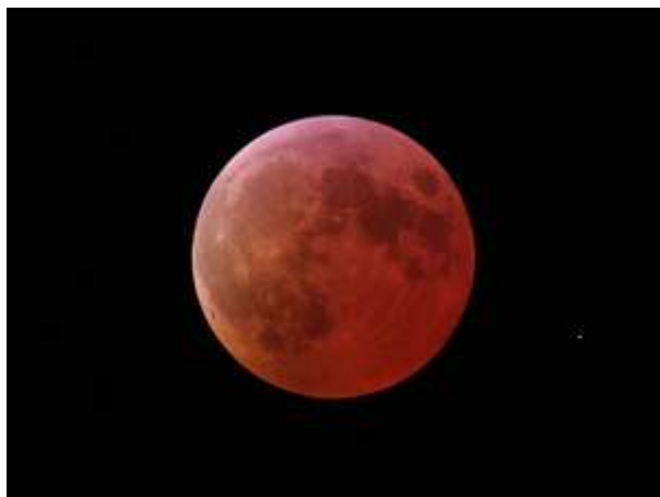
Úplné zatmění Měsíce v noci ze 3. na 4. března 2007 patřilo k relativně světlejším zatměním.

18. 1. 2008 nad ránem pak deset dnů starý Měsíc projde před otevřenou hvězdokupou Plejády. Od nás ovšem úkaz bude bohužel probíhat v čase východu Slunce takže jeho sledování bude velice problematické.