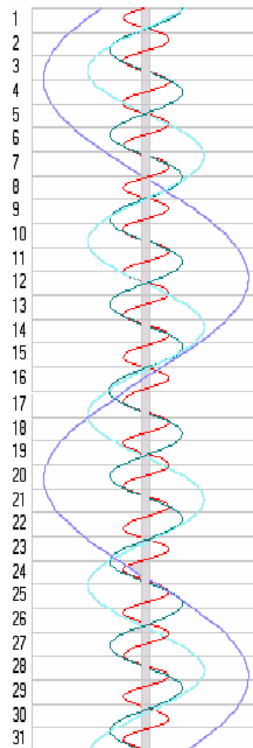
Pohyb Galileovských měsíců

Několik výzev pro majitele dalekohledů připravil v červnu především Jupiter a jeho Galileovské měsíce. Budou nám totiž nabízet různé zajímavé konfigurace. Například v noci z 22. na 23. června se dočkáme nad ránem dvojitého přechodu měsíců Europa a Ganymedes přes disk obří planety. V témže čase se nám naopak za kotoučkem Jupitera bude skrývat třetí jeho měsíc Io, který se do zákrytu dostane již kolem 2:22 SELČ. Přechod měsíce Europa začíná po třetí ráno. Napřed se na disku planety objeví jeho stín (ve 3:02 SELČ) a kolem 3:49 před kotouček planety vstoupí i sám měsíc Europa. O další hodinu později se na disk promítne stín dalšího z Galileovských měsíců – Ganymeda (4:42). To už také bude vedle planety opět zářit měsíc Io, který mezitím vystoupil zpoza planety. Bohužel závěr tohoto představení už nám znemožní pokročilé svítání a Jupiter rychle postupující k západu. Hned 24. 6. večer dojde v rychlém sledu dokonce ke trojici zákrytů Galileovských měsíců obří planetou. Ze střední Evropy bohužel uvidíme až pouze závěr série úkazů. Za kotouček Jupitera se postupně schovají Callisto, Io a Europa. Jupiter bohužel vyjde až po 22. hodině, kdy už Callisto bude po výstupu blízko planety. Ve 23:27 SELČ se k němu přidá Io a v 1:13, již 25. 6. i Europa.