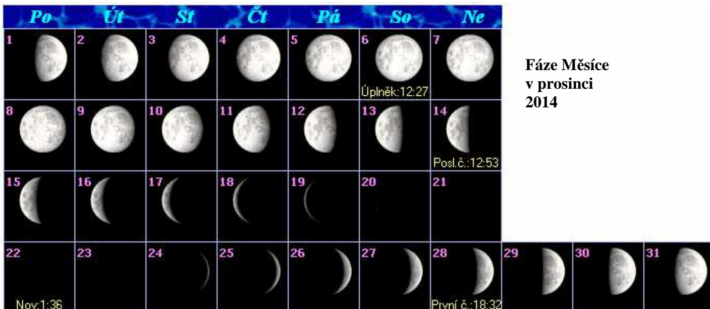
Fáze Měsíce v prosinci 2014