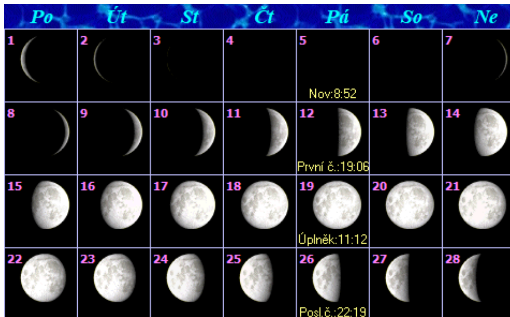
Fáze Měsíce duben 2019